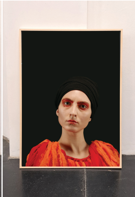
re-BIRDING / Laysan 'Apapane, 2023 Barytprint 100 x 140 cm, gerahmt 4 + 1 A.P. € 5.000,- (inkl. Ust)