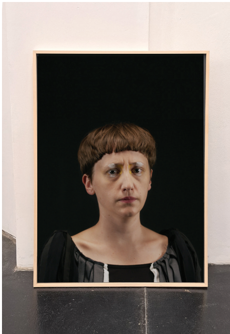
re-BIRDING / Lyall's wren, 2023 Barytprint 100 x 140 cm, gerahmt 4 + 1 A.P. € 5.000,- (inkl. Ust)