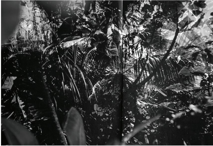
reconstructing archives by rendering representative complexities into moments of desire N°1, 2016 Pigmentdruck auf Fine Art Photo Cotton Rag 295g, 90 x 60 cm, gerahmt € 4.000,-