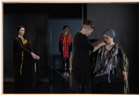
re-BIRDING / Production still 02, 2023 Barytprint 60 x 40 cm, gerahmt 4 + 1 A.P. € 2.500,- (inkl. Ust)