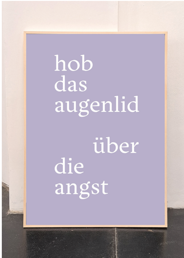
hob das augenlicht über die angst, 2023 Barytprint 120 x 170 cm, gerahmt 4 + 1 A.P. € 6.000,- (inkl. Ust)

hob das augenlid über die angst ist ein Filmstill aus re-GEO / rendering reconstructions of desire und wurde zunächst für die Installation Reconstruct, She said (Sehsaal, Wien, 2022) als Plakat produziert. Für einen Ankauf wird die Vorlage grossformatig auf Barytpapier gedruckt und gerahmt.