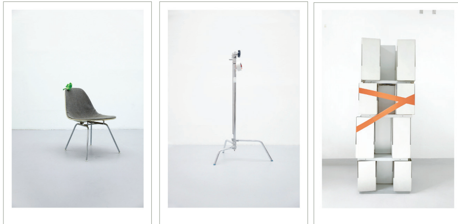
Giuliana, Martha, Myrtle. Fine Art Print auf Munkenpapier, 70cm x 110cm, gerahmt Auflage: 5 + 1 A.P. Preis (inkl. Ust): je € 3.000,- / Serie € 8.000,-