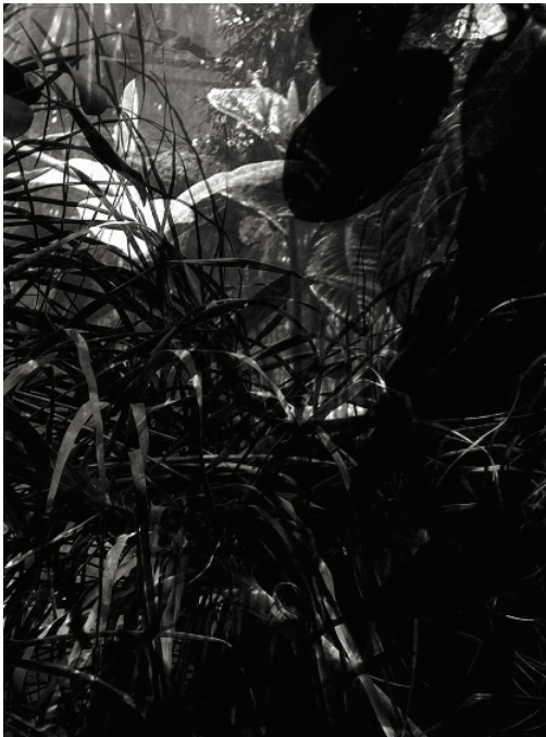
reconstructing archives by rendering representative complexities into moments of desire N°9, 2016 Analog-Reproduktion auf Barytpapier, 80 x 130 cm, gerahmt Auflage: 4 + 1 A.P. € 4.000,-

Was ist das Paradies? Ein Zustand? Ein Ort? Ein Garten? Ein Gewächshaus? Ein botanischer Garten? Ein Geschenk? Ein Souvenir? Beute, Profit? Kolonialisiertes Land, entwurzeltes Leben?