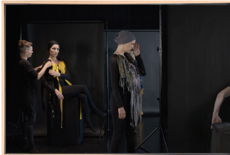
re-BIRDING / Production still 03, 2023 Barytprint 60 x 40 cm, gerahmt 4 + 1 A.P. € 2.500,- (inkl. Ust)