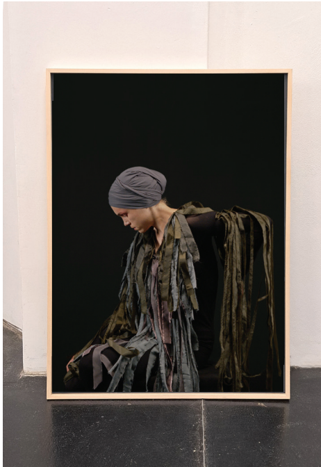
re-BIRDING / Passenger Pigeon Martha, 2023 Barytprint 100 x 140 cm, gerahmt 4 + 1 A.P. € 5.000,- (inkl. Ust)