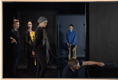
re-BIRDING / Production still 01, 2023 Barytprint 60 x 40 cm, gerahmt 4 + 1 A.P. € 2.500,- (inkl. Ust)