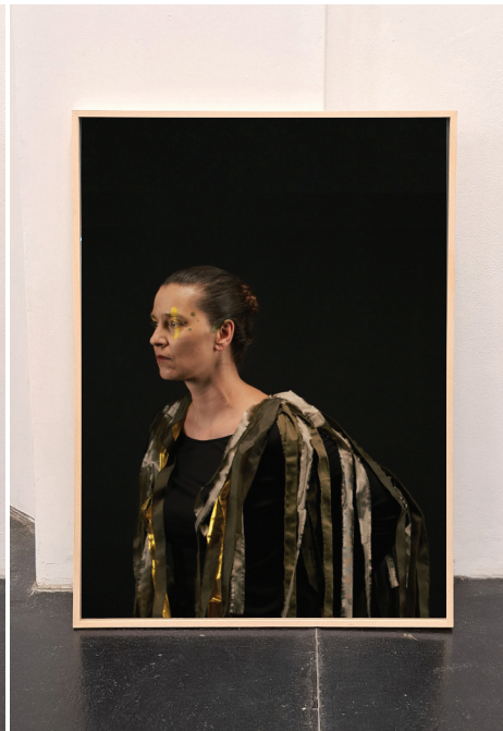
re-BIRDING / Kaua'i 'ō'ō, 2023 Barytprint 100 x 140 cm, gerahmt 4 + 1 A.P. € 5.000,- (inkl. Ust)

re-BIRDING Serie: € 18.000,- (inkl. Ust)