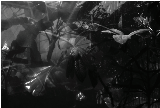
reconstructing archives by rendering representative complexities into moments of desire N°2 + N°4, 2016 Analog-Reproduktion auf Barytpapier, 50 x 40 cm, gerahmt je € 1.000,-