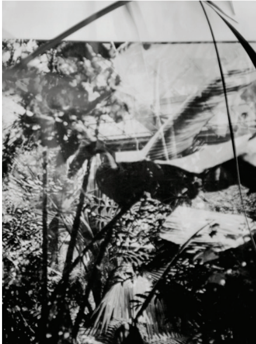
reconstructing archives by rendering representative complexities into moments of desire N°6, 2016 Analog-Reproduktion auf Barytpapier, 80 x 130 cm, gerahmt Auflage: 4 + 1 A.P. € 4.000,-